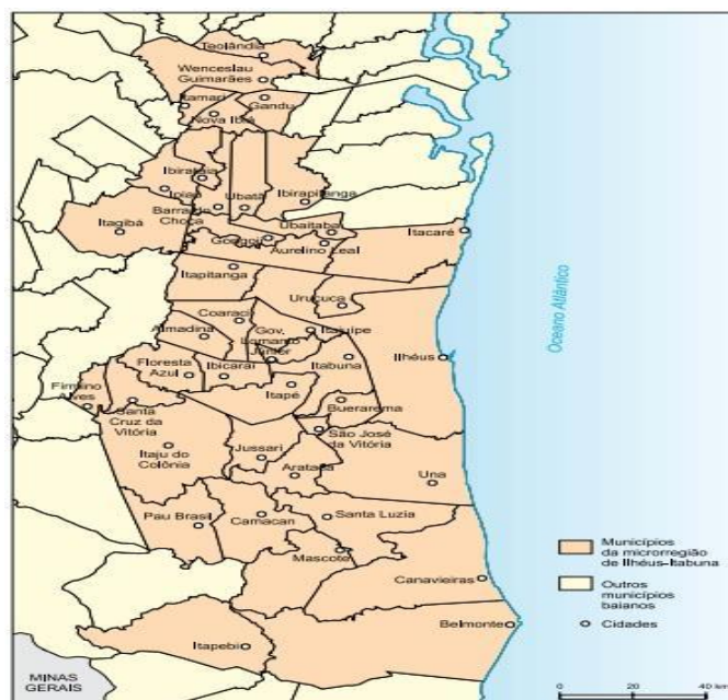
Figura 1: Municípios da Região Cacaueira do Sul da Bahia

Essas mudanças ocorreram com a participação de uma série de novos atores institucionais (seja da administração direta ou acadêmicos), empresariais e do terceiro setor, que fortaleceram a capacidade de absorção, geração e transferência de tecnologia da região, em paralelo com a emergência do tema Inovação no âmbito nacional.