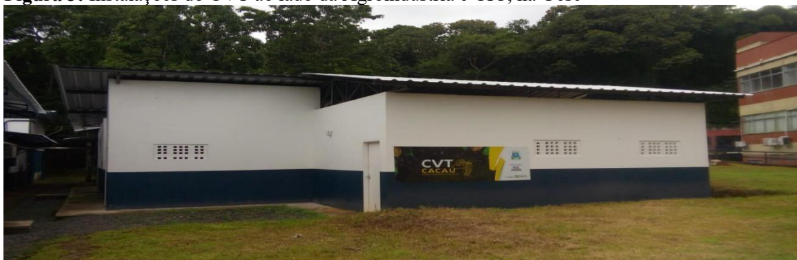
Figura 3: Instalações do CVT ao lado da Agroindústria e CIC, na Uesc