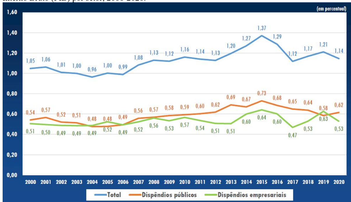
Figura 2: Dispendio nacional em Pesquisa e Desenvolvimento (P&D) em relação ao Produto Interno Bruto (PIB) por setor, 2000-2020.

Fonte: Coordenação Geral de Indicadores de Ciência e Tecnologia CGDI/DGIT/SEXEC/MCTI.