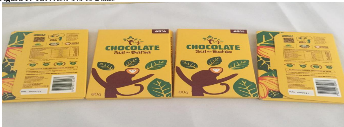
Figura 5: Chocolate Sul da Bahia