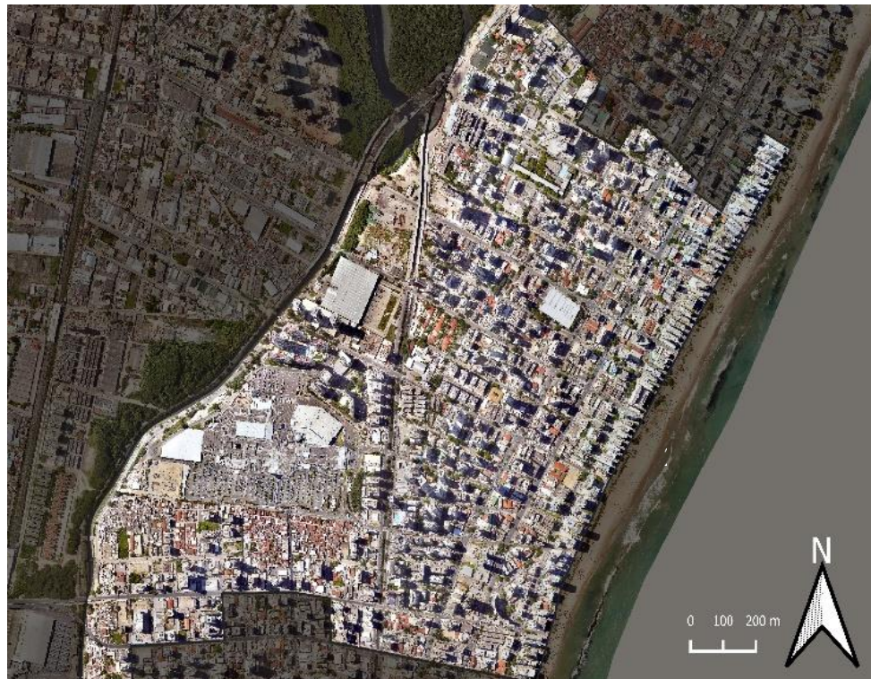
Figura 1. Localização das áreas de estudo (a) Praia da Boa Viagem (b) Praia da Rocha