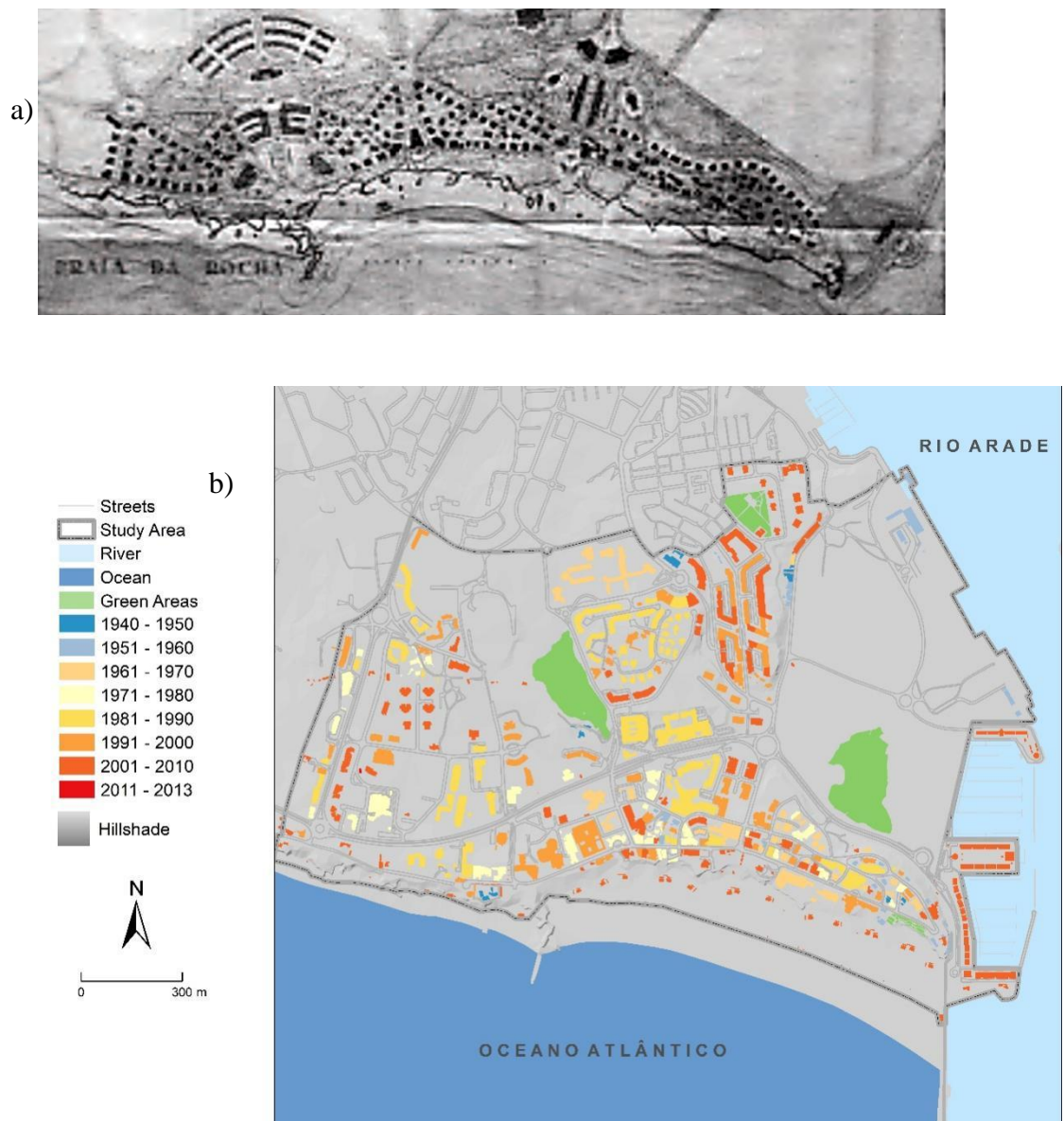
Figura 2. (a) PUPR 1930. (b) modelo atual do edificado da Praia da Rocha em 3D

Fonte: (a) Margarida Souza de Lôbo e (b) elaboração própria.